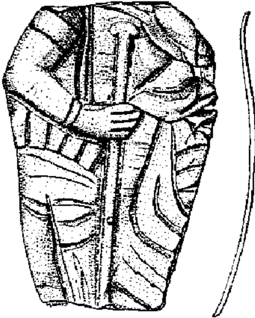
Fig. 4: Een fragment van een gouden figuur uit St. Klinteby te Bronholm (DK), 11de eeuw, schaal 2: 1 (Tek. M. Watt)

Bij de Venlose hanger is het gewaad voorzien van diverse plooien. De punten op de schouder kunnen gezien worden als schijffibulae die echter geen scherpe datering toelaten. (14) Als we de figuur iconografisch verder willen duiden dan is een Maria-voorstelling een mogelijkheid. De zittende figuur kan worden gezien als een zittende Maria met kind op de arm, een zogenaamde Sedes Sapientiae. Deze voorstelling is reeds bekend van karolingische miniaturen. In west-Europa zijn zeer veel voorbeelden bekend. Door het kind op de arm te houden wordt de menselijke relatie tussen Maria en het kind geaccentueerd. (15)