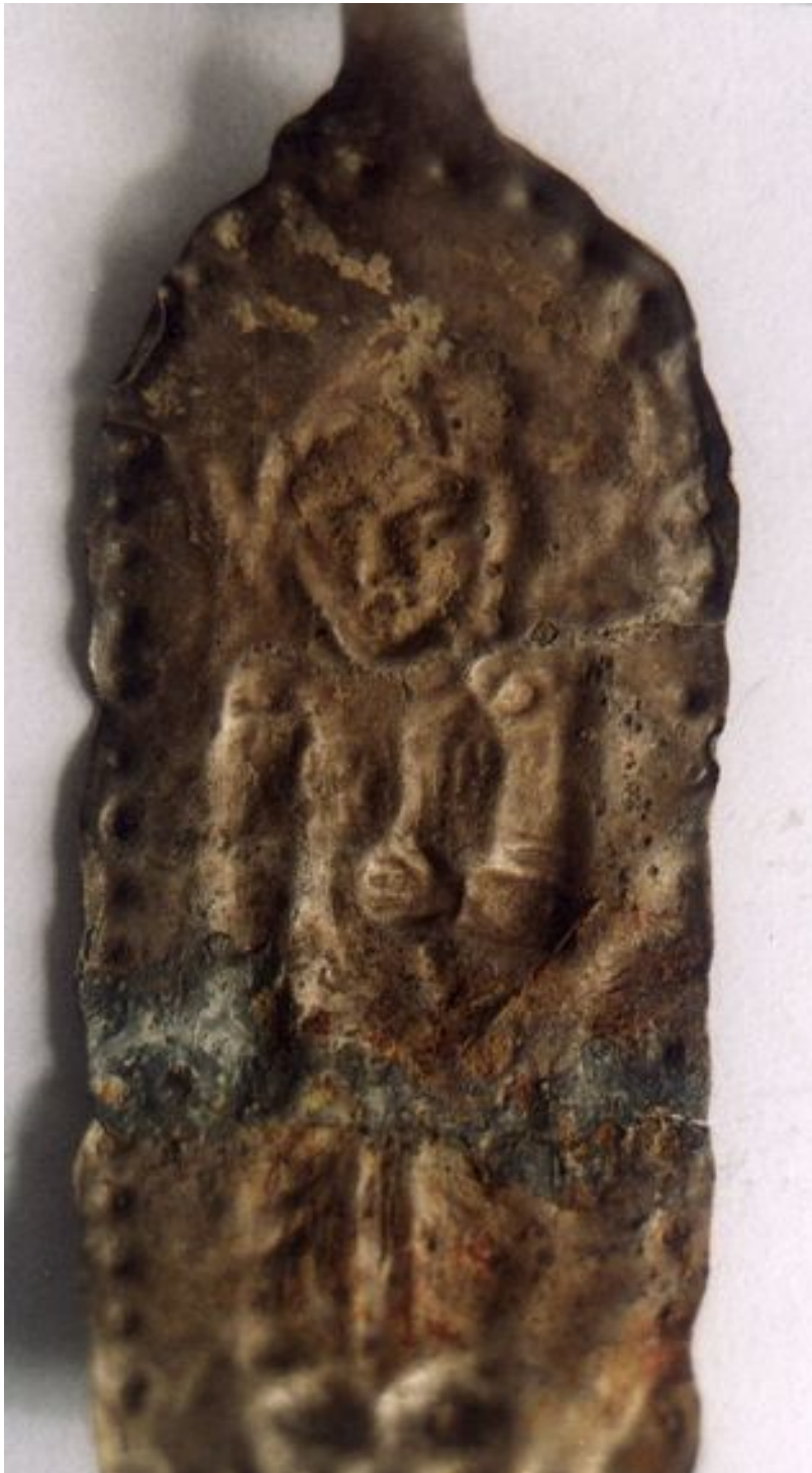
Fig. 1: De zilverblik hanger uit Venlo

Onlangs werd de collectie van het Limburgs Museum uitgebreid met een collectie metaalvondsten uit Noord- en Midden Limburg. In deze collectie bevindt zich een klein hangertje van zilverblik met een mysterieuze afbeelding (Fig. 1 en 2). (3) Herkenbaar is een zittende figuur, gekleed in een lang gewaad met de rechterarm gebogen en de linkerarm recht naast het lichaam. Het afgelopen jaar is door diverse deskundigen naar het hangertje gekeken zonder dat een sluitende interpretatie kon worden gevormd. In dit artikel worden de vondstomstandigheden en de diverse interpretaties kort uiteengezet.