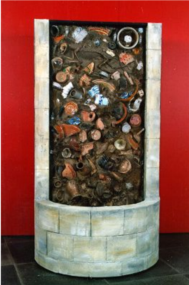
Reconstructie van een beerput gevuld met aardewerk, glaswerk, leerresten en botmateriaal (Collectie Limburgs Museum)

In deze inleiding zal kort worden ingegaan op de verschillende onderzoeksmogelijkheden en de onderzoeksresultaten van de werkgroep. Daarbij wordt het overzicht zoveel mogelijk beperkt tot de situatie in het huidige Nederlands Limburg gedurende de vroeg-moderne periode.