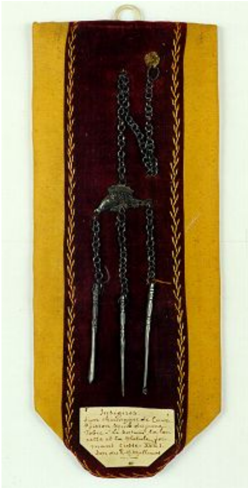
Een voorbeeld van een volkskundig object: Insigne van een chirurgijn te Maastricht, omstreeks 1700 (Collectie Limburgs Museum, bruikleen Limburgs Geschied- en Oudheidkundig Genootschap)