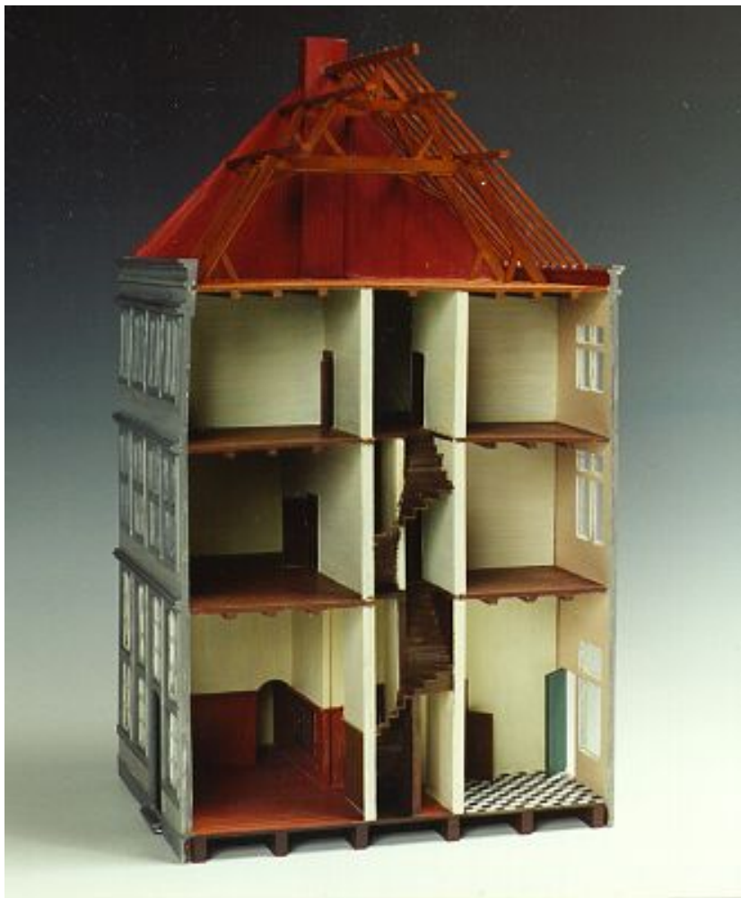
Maquette van een eind achttiende eeuws Maastrichts burgerwoonhuis gemaakt door P. van Nunen (Collectie Limburgs Museum)

Het is wenselijk dat verschillende materiaalgroepen (bijvoorbeeld uit goed gedateerde beerputten) uit de verschillende Limburgse steden vergeleken worden. Op die manier ontstaat meer duidelijkheid over het voorkomen van bepaalde voorwerpen of materialen en kan worden gebouwd aan een referentiekader waarbinnen archeologische vondsten kunnen worden geïnterpreteerd. (6)