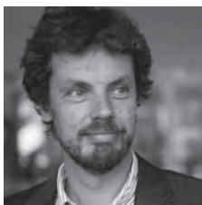
Arjen Versloot , sinds 1 septem- ber hoogleraar Germaanse taal- kunde, in het bijzonder de Duitse, Scandina- vische en Friese talen

De informatie voor aankomende studenten ( studeren.uva.nl ) is ingevoerd in het nieuwe systeem en is kritisch bekeken, met name de Engelstalige informatie (26 van de 64 bacheloropleidingen en 64 van de 227 masterprogramma's van de UvA vallen onder de FGw).